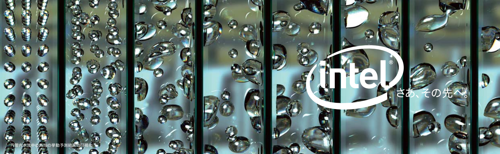
円管内水流中の気泡の挙動予測結果の可視化