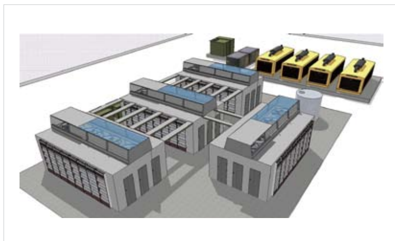
大型モジュール導入のイメージ図